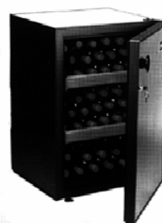
Cave à vin grand modèle