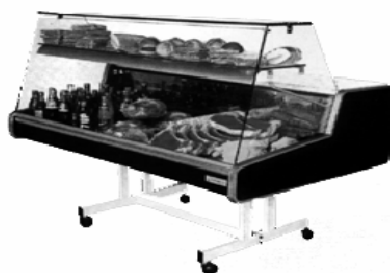
Vitrine réfrigérée Long 150 – prof 95 – Ht 114