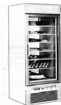
Armoire réfrigérée Long 67 – prof 68 – Ht 196